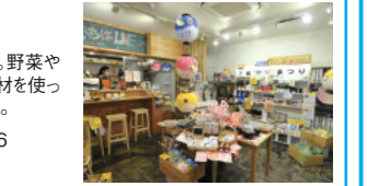
↑ちよだいちばで月1回開催している、名産品を肴に飲む「いちばのちよい飲み」は毎回大盛況

ちよだいちば 「地方のおいしいもの」を取り揃えたアンテナショップ。野菜や果物のほか、特産品や名産品がたくさん。ご当地食材を使った手作りのお弁当も人気です。イベントも各種開催中。 〒千代田区神田錦町2-7-14 ☎03-5577-3846 時11:30~18:00 休土・日・祝