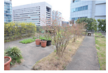
↑屋上菜園「ちよだ Sky Village」では農作業の体験とともに収穫イベントも行っている

町村のアンテナショップ」として「月間ご当地まつり」を開催し、月ごとにさまざまな市町村を取り上げています。3月は山口県下関市、4月は岩手県釜石市・大槌市、5月はまだ未定ですが、どうぞお楽しみに! また、「ちよだプラットフォームスクウェア」の屋上菜園で36種類の野菜を作っていて、こちらの農業体験も月に1度行っています(毎月最後の日曜日)。収穫した後は採れたてを味わっていただけます。ぜひ一度お立ち寄りください。