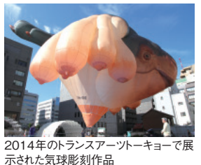
2014年のトランスアートキーヨーで展示された気球彫刻作品

アートによって地域を活性化しようと、神田のまちを舞台にアートプロジェクトを展開している「コマンドN」。彼らの拠点が神田錦町二丁目にあります。2012年から毎年秋に開催されている「トランスアートキーヨー」では、旧東京電機大学跡地など神田エリアに点在する会場で、さまざまな展示やイベントが行われます。今度はどんなイベントを仕掛けてくれるのか。神田のまちを元気にする、彼らの活動に注目です!